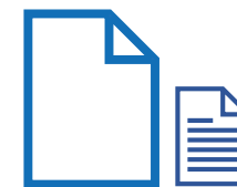
Folios, cartulinas y tickets de compra