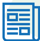
Periódicos y revistas