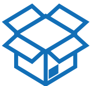
Cajas de cartón