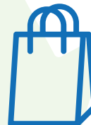
Bolsas y envoltorios de papel