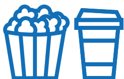
Envases de comida y vasos de cartón (si no contiene restos de café o comida)